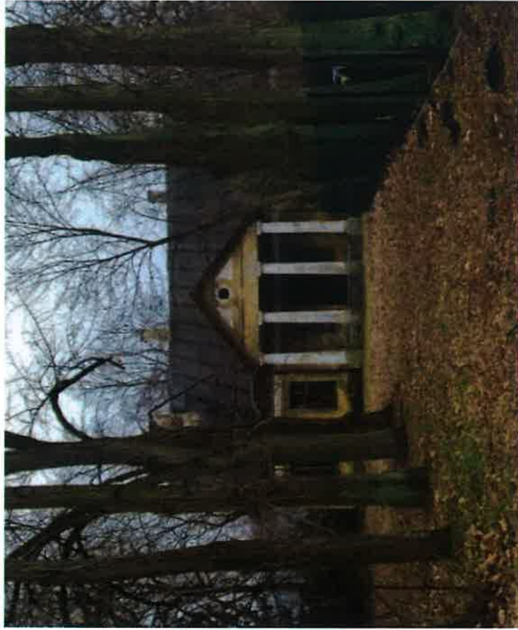
Fasada dworu wraz z zabytkową aleją lipową.